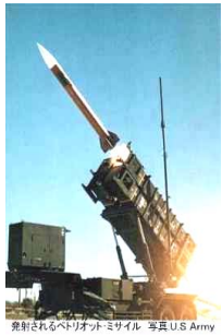
PAC3 を入間基地に配備。 1 発 4 億円

ペダルを踏んで戦争反対！危険な軍事基地に税金を使わないで！ソマリア沖・シブチ派兵は憲法違反！ヨコタ基地に日米合同ミサイル司令部をつくるな！